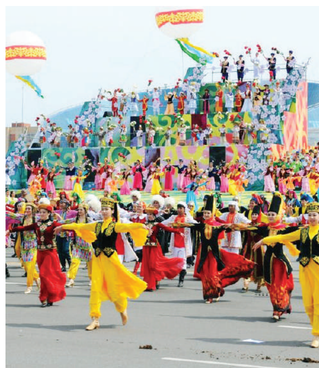
Бірлік пен ынтымақ – ешқашан ескірмейтін құндылықтар екеніне осы күндерде жұртшылықтың көзі жетті деуге болады. Бұл күнде еліміздің

Еліміз 1 мамыр – Қазақстан халқының бірлігі күнін атап өтеді. Биыл бұл бүкілхалықтық мерекенің бәсі биік, абыройы айрықша. Президент айтқандай, ол мемлекетіміз үшін күрделі кезеңге тұспа-тұс келді, ел өңірлерінің басым көпшілігі алапат тасқынға ұшырады. Осы сын сағатта, қиынқыстау заманда халқымыз бұра тартып, бір-бірінен теріс айналмады, бірліктің бәйгетөбесіне бірлесе ат байлап, қатар қимылдады. Осы арқылы әлем алдында мемлекет беделін де, өз қадірін де биіктетіп, мерейі өсті.